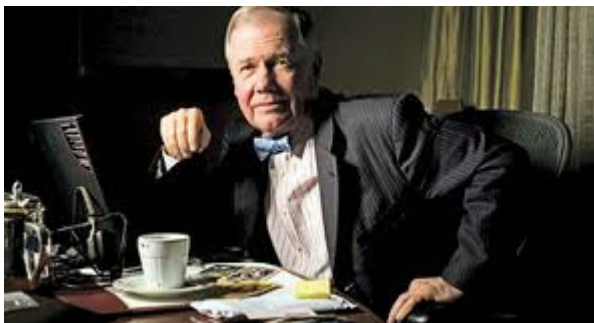
จิม โรเจอร์ส (Jame B. Rogers)

“ การทำตามอย่างสิ่งที่คนอื่น ๆ กำลังทำ...ยากนักจะเป็นหนทางสู่ความมั่งคั่ง ”